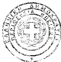
Γιώργος Γιαννούρας Προϊστάμενος Μονάδας Γ' ΕΥΔ ΕΠ ΠΕΡΙΦΕΡΕΙΑΣ ΗΠΕΙΡΟΥ